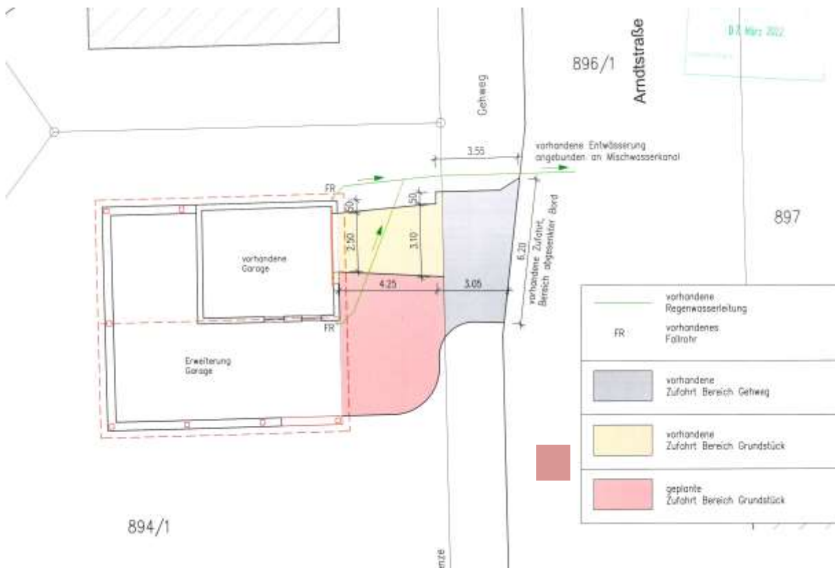
Auszug Lageplan zum Bauantrag