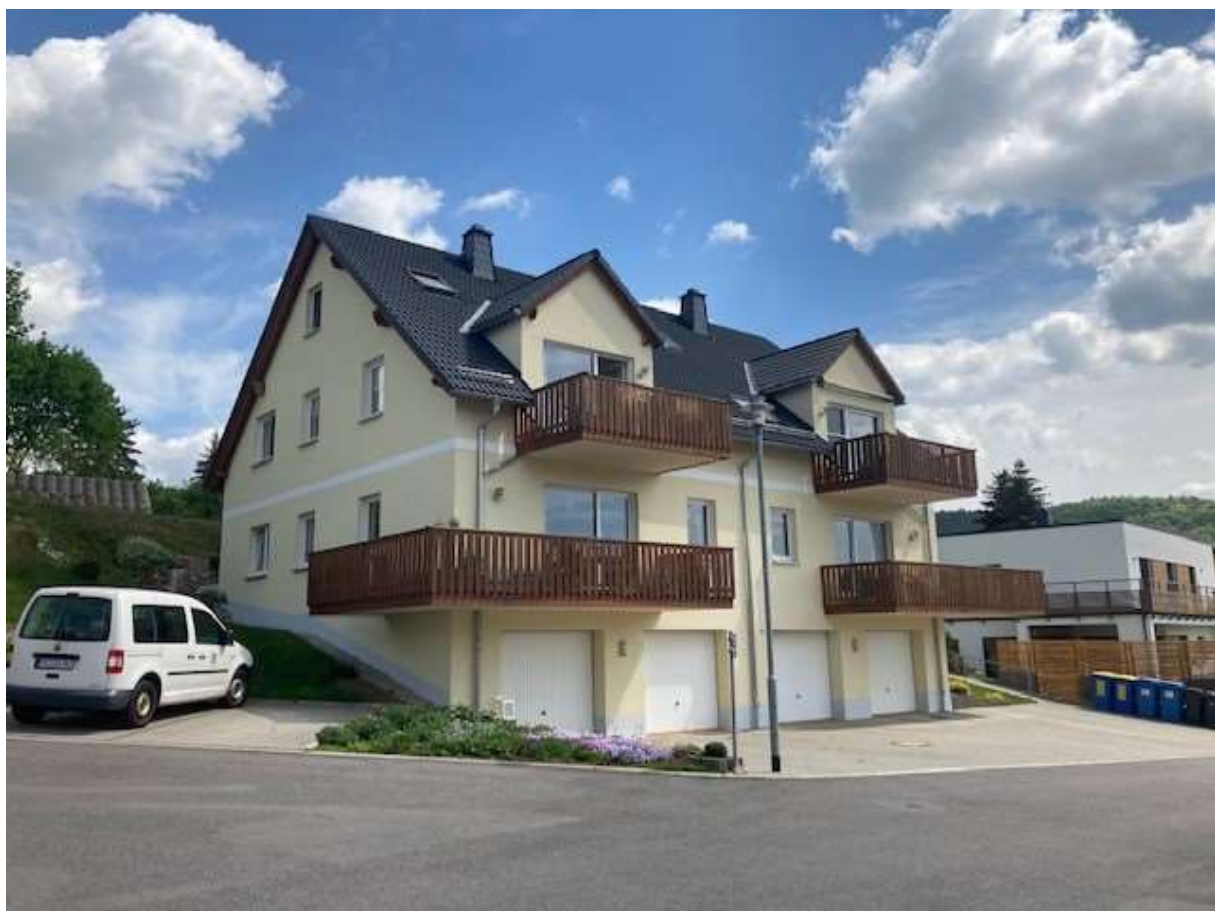
4-Familienwohnhaus Sonnenleithe Nr. 4 – vergleichbares Gebäude – Foto vom 13.05.2022 Insofern das Kellergeschoss (Garagen) im Mittel nicht mehr als 1,40 m über die Geländeoberfläche hinausragt, stellt dieses kein Vollgeschoss nach § 90 Abs. 2 SächsBO dar.