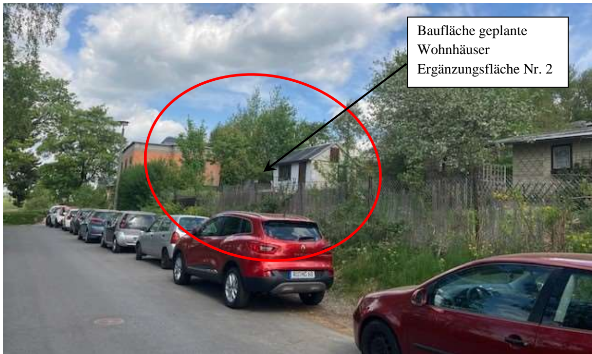
Foto Baugrundstück vom 13.05.2022 – Ansicht Dittersdorfer Weg in Richtung Nord-West