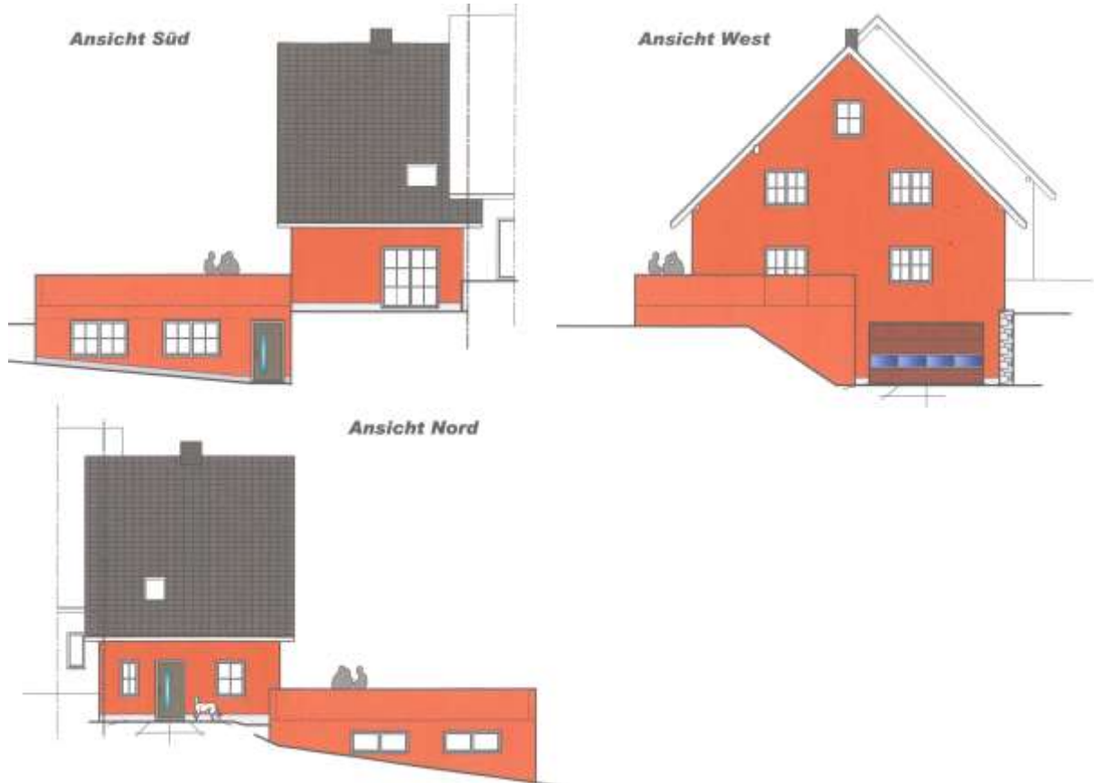
Auszug Anichten zum Bauantrag – 1. Tektur