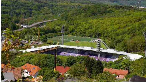
Geisterspiel gegen Sandhausen

Fußball-Zweitligist FC Erzgebirge holt in der zweiten Partie nach der Corona-Pause einen Punkt beim 1.FC Nürnberg. Es stand 1:1 nach dem Schlusspfiff. Das Spiel fand am 22.05.2020 statt.