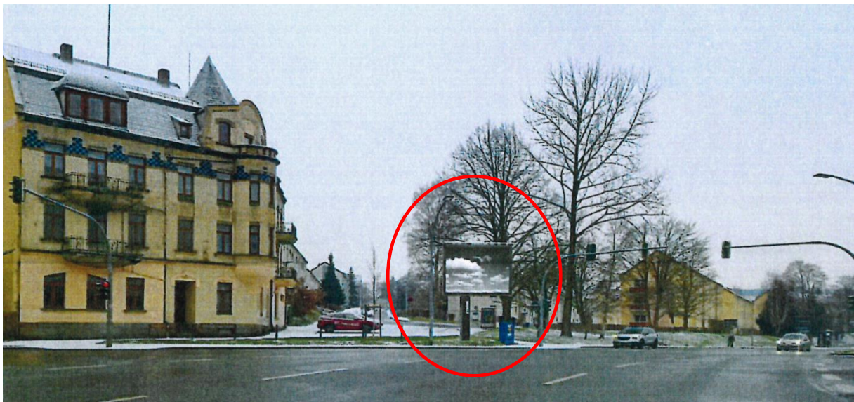
Abbildung 2 – Animation geplante Werbeanlage

Die beantragte Werbeanlage hat Fremdwerbung zum Gegenstand, ist als eine bauliche Anlage im Sinne des § 29 Satz 1 BauGB zu bewerten und stellt insofern als gewerbliche Nutzung eine eigenständige Hauptnutzung nach §§ 2 ff. der Baunutzungsverordnung (BauNVO) dar.